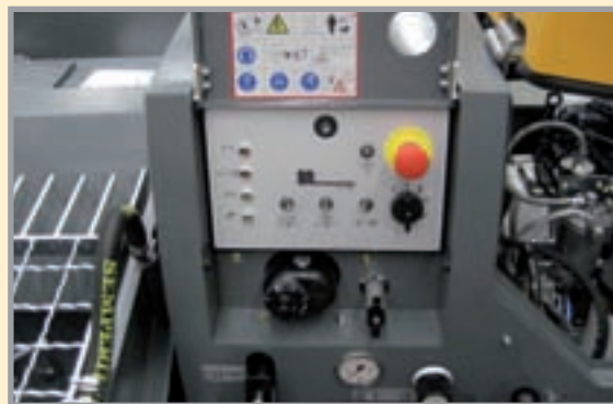
Управление всеми функциями SP 11 осуществляется посредством панели управления. Машина соответствует стандартам CE.